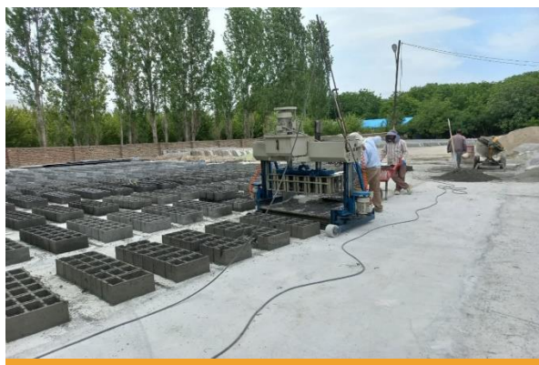
دستگاه تولید بلوک های بتنی