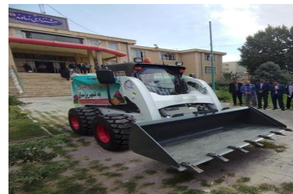
مینی لودر به مبلغ ۱۳/۰۰۰/۰۰۰/۰۰۰ ریال