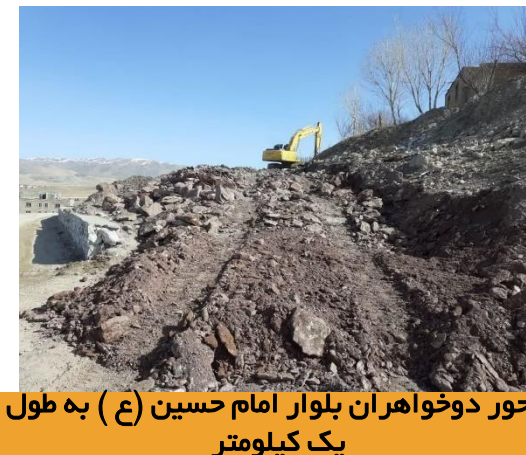
محور دوخواهران بلوار امام حسین (ع) به طول یک کیلومتر