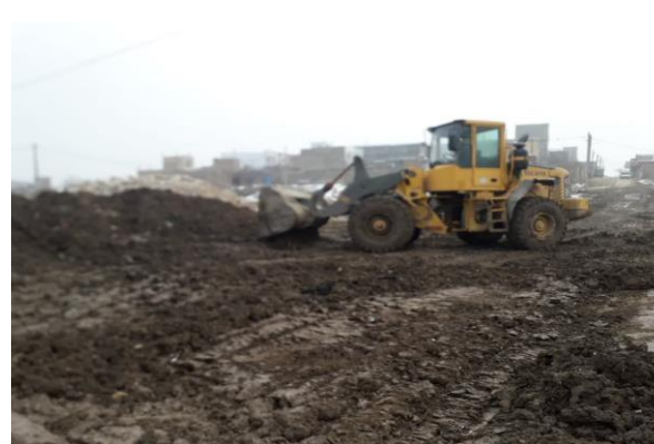
بازگشایی معابر، بیش از ۵۰ معبر به مساحت ۴۹۰۲۰۰ متر مربع