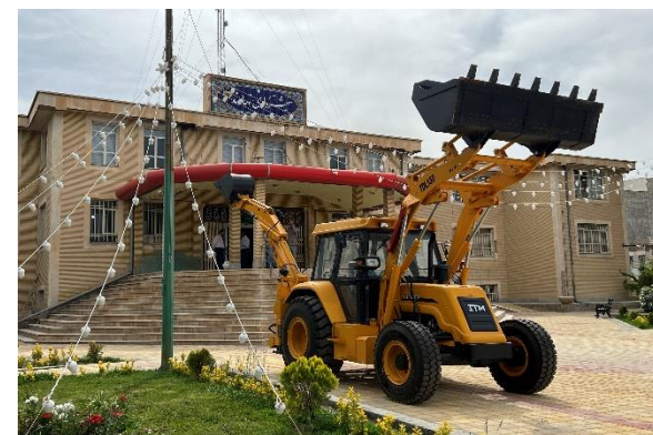
بیل بکھو به مبلغ ۲۲/۵۰۰/۰۰۰/۰۰۰ ریال