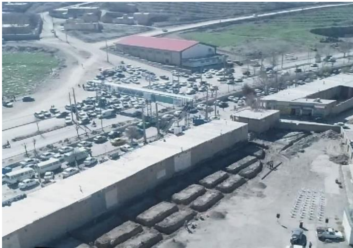
تصویب و شروع عملیات اجرایی بازار خودرو

در راستای درآمد پایدار و خودکفایی شهرداری