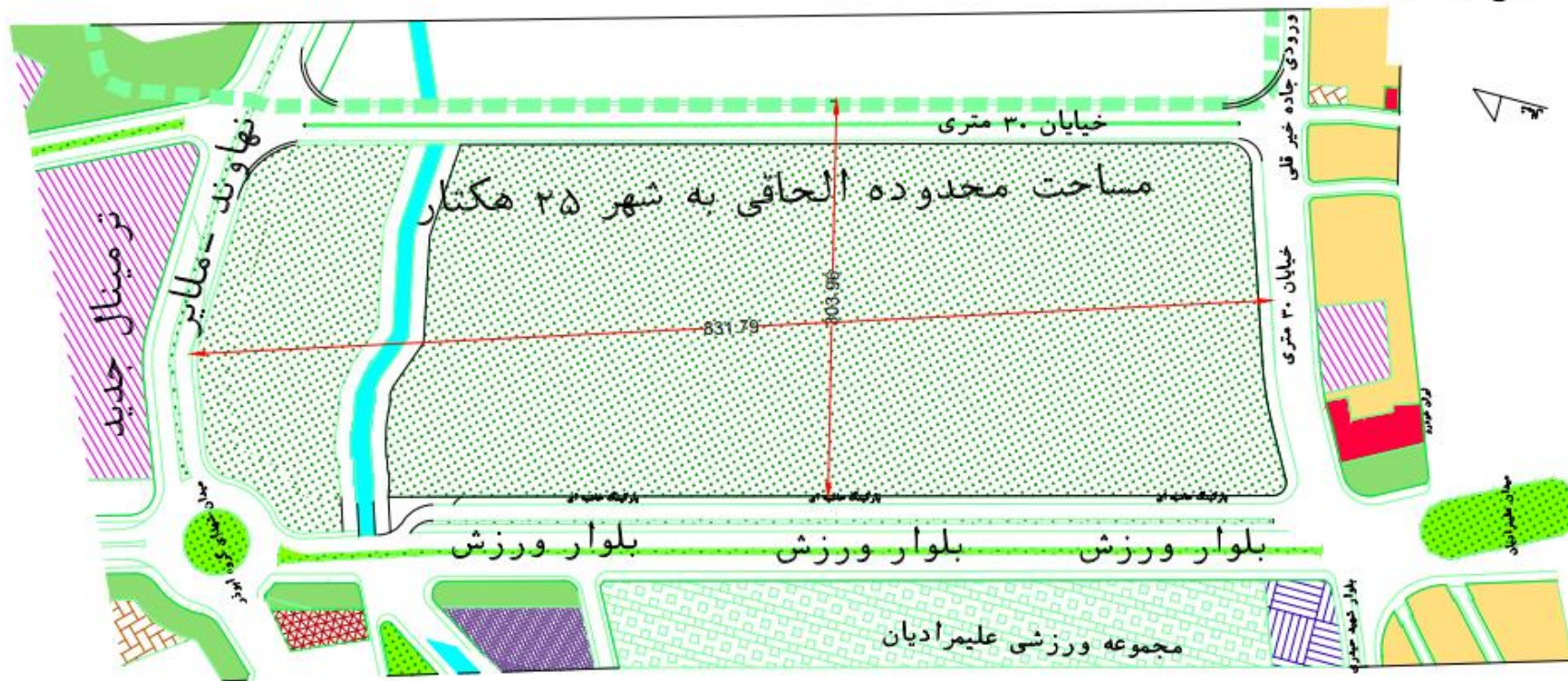
پارک فرامنطقه ای