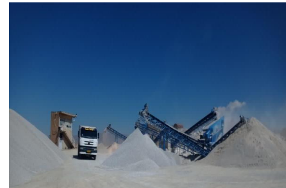
کارخانه آسفالت و تولید شن و تولید ۱۸ هزار تن آسفالت