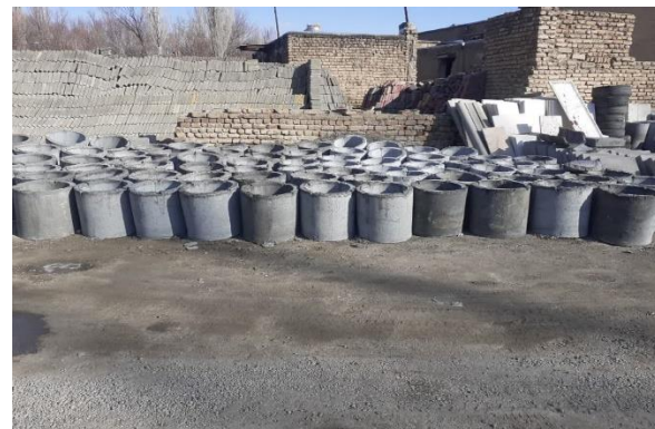
تولید دال بتنی ۱۰۲ عدد - تولید سنگ قبر ۲۷۷۴ عدد