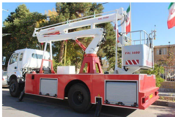
بالابر هیدرولیکی آتش نشانی به مبلغ ۱۳/۰۰۰/۰۰۰/۰۰۰ ریال