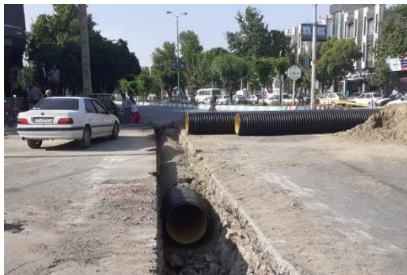
لوله گذاری بیش از ۱۵ معبر به مقدار ۵۰۰ متر