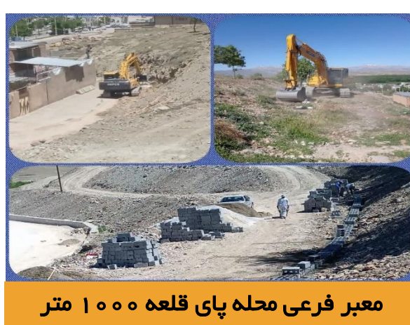
معبر فرعی محله پای قلعه ۱۰۰۰ متر