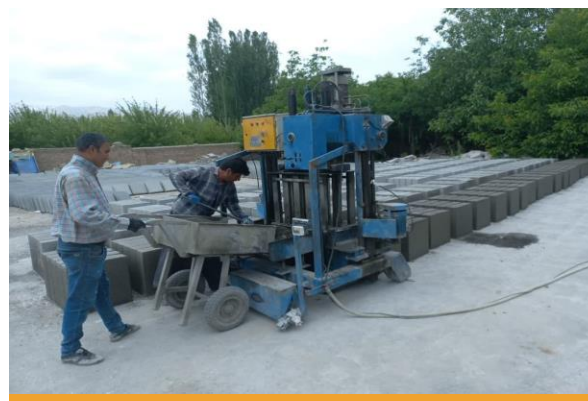
دستگاه تولید جدول های بتنی ۹۱ × ۴۷۰ عدد