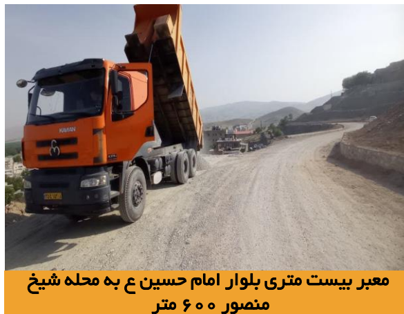
معبر بیست متری بلوار امام حسین ع به محله شیخ منصور ۶۰۰ متر