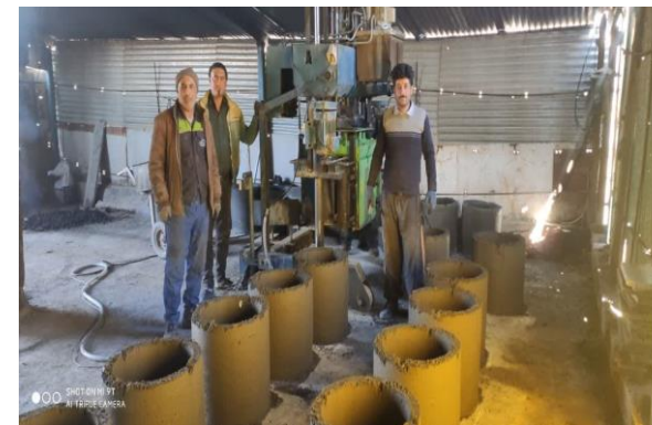
تولید لوله های بتنی ۹۰ × ۶ عدد