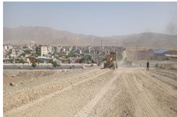
بیس ریزی ۴۵۰ معبر به مساحت ۱۰۰ هزار متر مربع