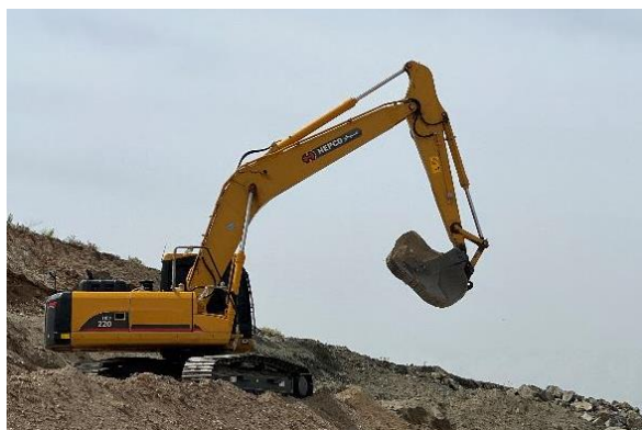
بیل زنجیری به مبلغ ۷۰/۰۰۰/۰۰۰/۰۰۰ ریال