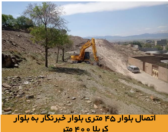
اتصال بلوار ۴۵ متری بلوار خبرنگار به بلوار کربلا ۴۰۰ متر