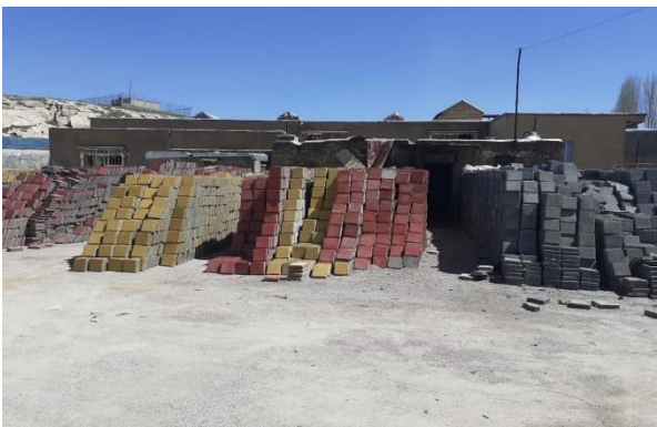
کل تولیدات کارگاه بتن ۱۳۵۳۶۷ عدد