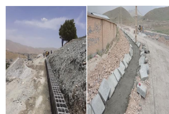
جمع آوری آبهای سطحی و جدول کشی و بلوک گذاری بیش از ۱۵۰ معبر به مساحت ۱۸ هزار متر مربع

در راستای درآمد پایدار و خودکفایی شهرداری