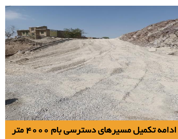
ادامه تکمیل مسیرهای دسترسی بام ۴۰۰۰ متر