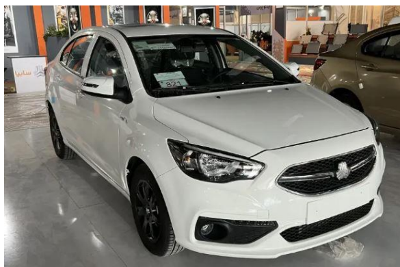
مشاین سواری شاهین به مبلغ ۳/۷۰۰/۰۰۰/۰۰۰ ریال