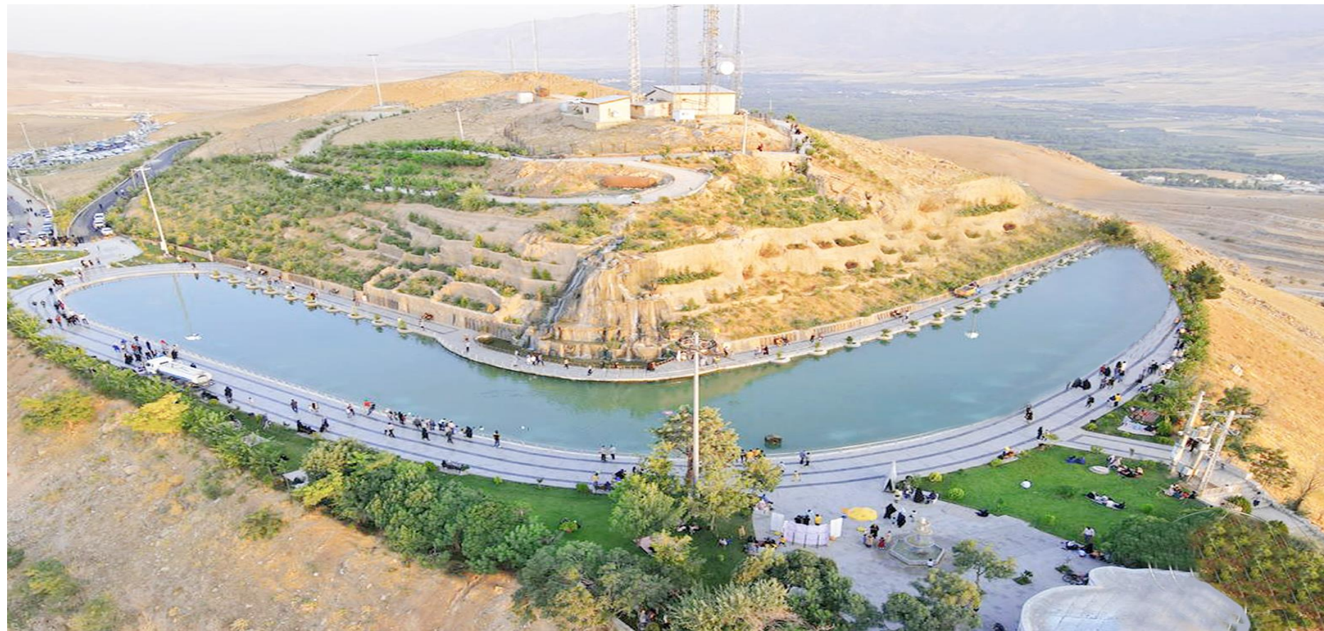
طرح توسعه بام نهاوند