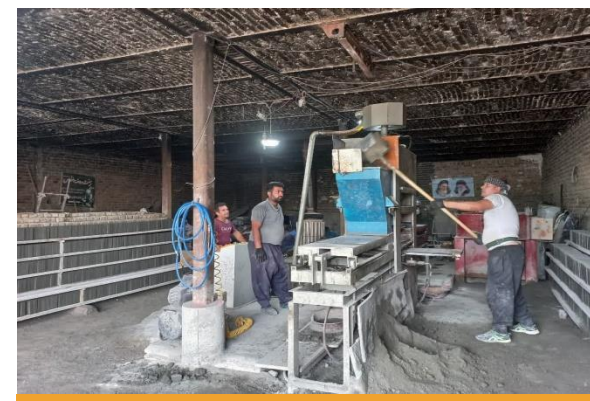
دستگاه تولید کفیوش های بتنی ۱۰ × ۸۴۷۱ عدد