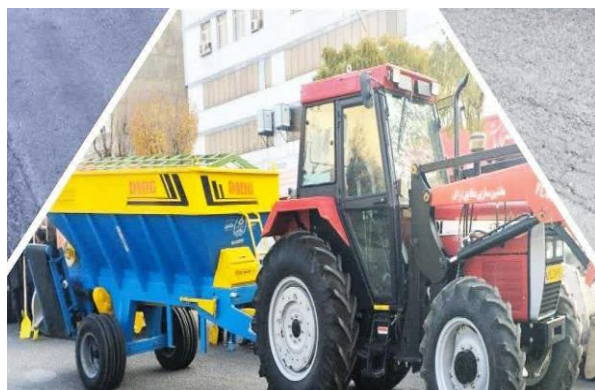
تراکتور به مبلغ ۲/۲۰۰/۰۰۰/۰۰۰ ریال