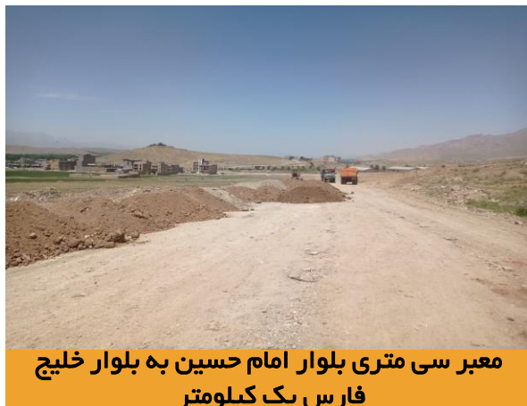
معبر سی متری بلوار امام حسین به بلوار خلیج فارس یک کیلومتر