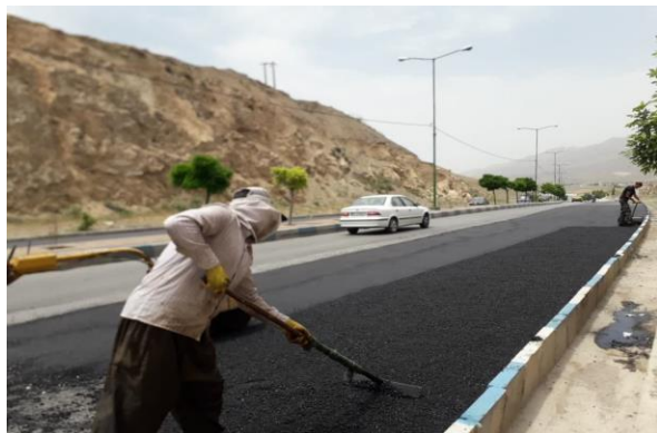
آسفالت بیش از ۴۰۰ معبر شهری به مقدار ۱۶۳ هزار متر مربع

عملیات روکش آسفالت 400 معبر لوله گذاری 15 معبر جدول گذاری 300 معبر شهری بیس ریزی 450 معبر شهری